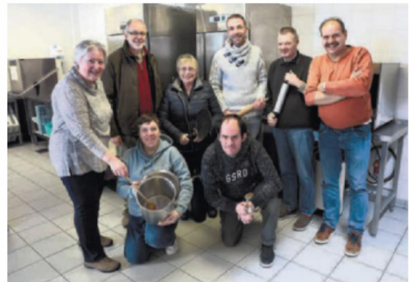
Het Kruimelcafé zal zich in het complex 't Bourgondisch Hof bevinden.

Welzijnsschakel De Klapdeur ging op zoek naar een geschikte locatie met een grote, goed uitgeruste keuken. Die werd gevonden in 't Bourgondisch Hof. Daar zal het Kruimelcafé plaatsvinden met de medewerking van de Tordale-cliënten. "Waarschijnlijk zal het Kruimelcafé vanaf juni elke donderdag om 17 uur toegankelijk zijn", vervolgt Jaak. "Eerst wordt de soep opgediend, daarna staat er een buffet met keuze uit diverse hoofdschotels ter beschikking. Ook een dessertje hoort erbij. Om 18.45 uur wordt er opgeruimd en samen afgewassen." Op donderdag 8 februari om 14.30 uur in de Beerstraat 20 wordt er een infosessie georganiseerd voor medewerkers. Info: deklapdeurtorhout@gmail.com, 0493 15 46 85, 0474 21 64 37. (JS)